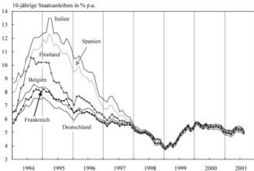
Abbildung 1 Konvergenz der langfristigen Zinsen

Man kann die deutsche Steuerreform des Jahres 2000 durchaus als Ergebnis dieser Entwicklung sehen, denn sie war ähnlich wie das sogenannte „Standortsicherungsgesetz“ von 1994 explizit mit dem Standortwettbewerb, in dem sich Deutschland befindet, begründet worden. Deutschland bildet, was das Wachstum betrifft, nun schon seit einigen Jahren das Schlusslicht unter den EU-Ländern. Die Senkung des Körperschaftsteuersatzes auf nur 25% soll eine Trendumkehr bewirken und das Kapital im Lande halten.